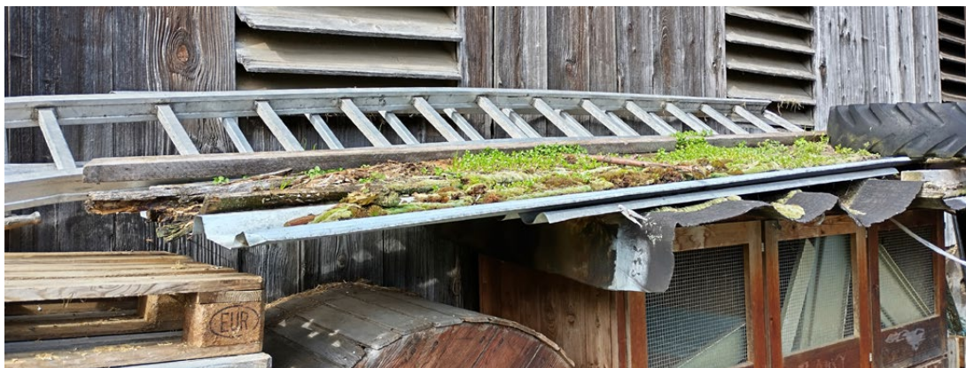
Grüne Dächer, auch ganz unkonventionelle, liegen voll im Trend.

Gründächer mit Solarenergieanlagen sind an Voraussetzungen gebunden. So müssen beispielsweise ortsbezogene Schnee-, Wind- und Ballastierungslasten ermittelt sein, die Auflasten der Photovoltaikanlage sowie Reserve- und Punktlasten, zum Beispiel beim Zwischenlagern des Materials vor und während der Installation, berücksichtigt werden. Auch die spezifischen Gewichte der Substratschichten müssen eingerechnet werden. Bei bereits vorhandenem Dachaufbau erfolgt zuvor ein Dachcheck durch einen Gebäudehüllenspezialisten, also eine Zustandsanalyse, ob die künftig vorgesehene Nutzung und Nutzungsdauer erreicht werden kann.