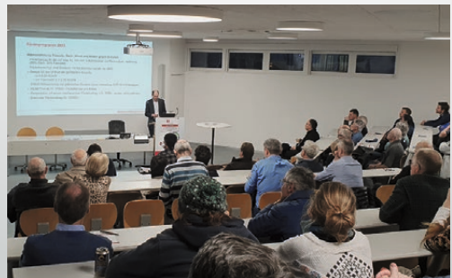
Fachvorträge 2023: Grosses Interesse