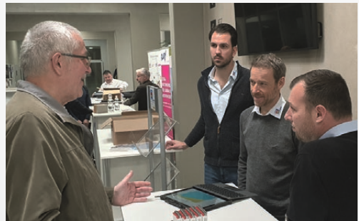
Beratungen aus erster Hand 2023