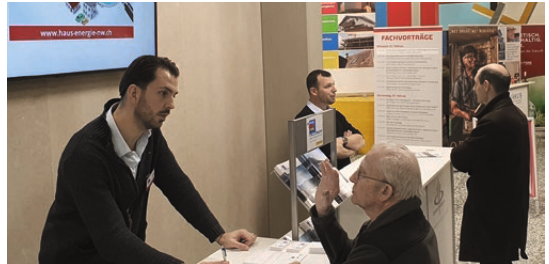
Impressionen der Nidwaldner Energietage 2023