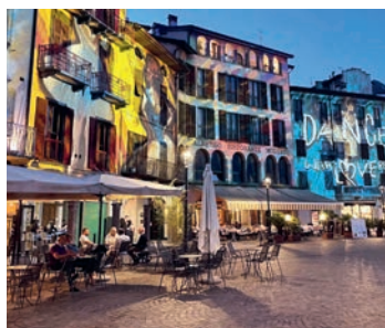
La Piazza - originale

«DIE ÄLTERE DAME VON GESTERN... DIE MIT IHREM HUND! ER ANGEZOGEN WIE SIE!... DER PUDEL... ELEGANT!»