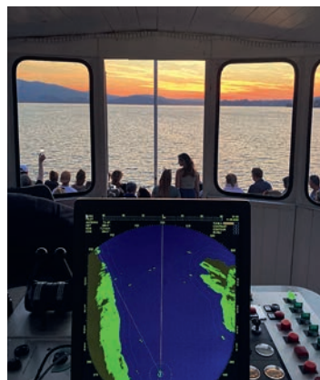
Partystimmung am Abend

Autofähre Vierwaldstättersee Infos, Fahrplan, Tarife unter info@autofaehre.ch www.autofaehre.ch Telefon 079 130 14 30