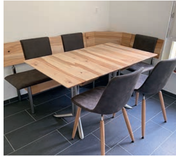
Wir haben für jede Ecke die passenden Eckbank.

Seit 20 Jahren betreiben Cornelia und Hanspeter Bieri an der Gewerbestrasse 7 in Cham ihr Möbelgeschäft. In der Ausstellung finden sich traditionelle wie auch moderne Garnituren. Ein Nischenprodukt, individuell auf Kundenwünsche abgestimmt. Die Eckbank hat sich, wie vieles andere auch, weiterentwickelt. In den Köpfen vieler steckt das Bild von einer dunklen schweren Eckbank wie bei den Grosseltern. Doch heute haben viele Familien wieder Freude an einer Eckbank. Modern und leichter im Aussehen punktet die Funktionalität und Freude an diesem vielseitigen Möbelstück. Die Eckbank passt sich an, ob in der modernen Wohnküche als Sitzecke oder für die Ferienwohnung. Die Ausziehbank lässt sich im Alltag gut unter dem bestehenden Sitz verstauen, um sie bei Bedarf zu verlängern. Wussten Sie, dass sich eine Eckbank auch an die Wand montieren lässt? Dank Konsolen fallen die Beine weg, wodurch sich das Reinigen sehr vereinfacht. Natürlich passen Tische, Funktionalität, Aussehen und Grösse dazu. Auch hier gibt es diverse Verlängerungen, ob zum Verstauen im Tisch oder zur externen Aufbewahrung. Auch Wohnmöbel stellen wir gerne nach Mass her. Ihre gepolsterte Eckbank oder Stühle sind in die Jahre gekommen oder langsam durchgessen? Gerne erledigen wir eine Auffrischkur. Sie suchen einen neuen Bezug aus, und wir bringen Ihr geliebtes Möbelstück wieder zum