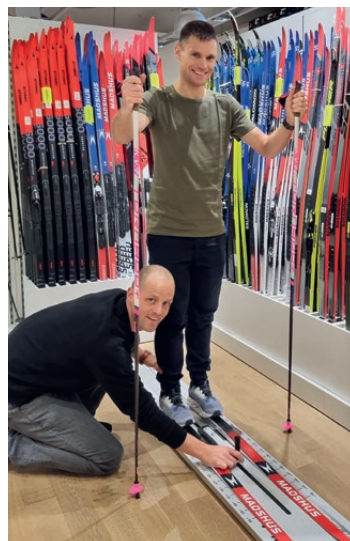
Testen ob die Spannung stimmt – bei Klassisch Ski unerlässlich